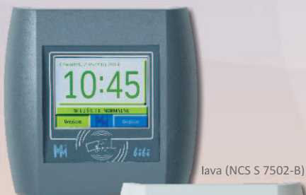
lava (NCS S 7502-B)

Wyróżnione dwoma Złotymi Medalami MTP na Międzynarodowych Targach Zabezpieczeń SECUREX 2014.